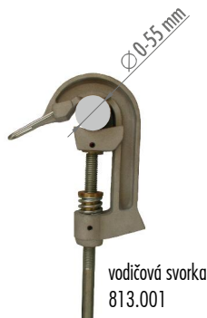
vodičová svorka 813.001