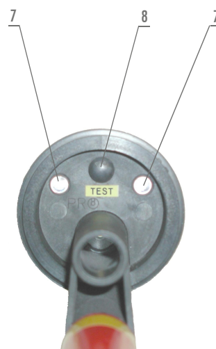
dotykový hrot 3,6 - 38,5 kV