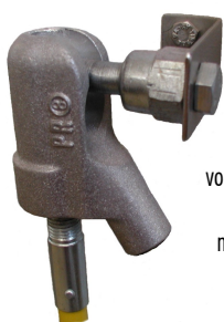
vodičová svorka 826.003 (připojovací bod není součástí dodávky)